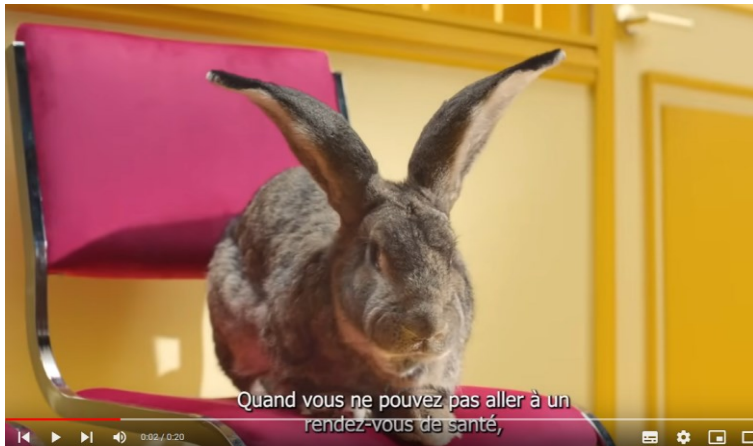
Spot « Annuler un rendez-vous de santé »