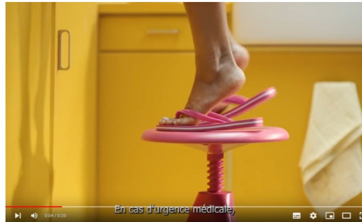
Spot « Appeler le 15 en cas d'urgence »