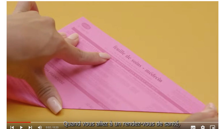
Spot « Présenter sa carte Vitale »